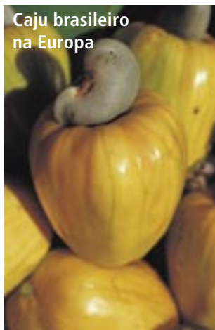
Caju brasileiro na Europa

O Brasil já é o 3º maior produtor mundial de frutas, com 43 milhões de toneladas/ano – produção estimada em 2003. A Comunidade Européia já importa 70% da nossa produção, sendo atualmente a principal consumidora das frutas frescas brasileiras. Mercosul, 11%; Alca, 12%; e outros, 7%. Estes resultados significativos estão registrados no Relatório do Programa de Produção Integrada de Frutas (PIF), que acaba de ser concluído. O PIF foi criado em 2000 pelo Ministério da Agricultura, Pecuária e Abastecimento (MAPA), em parceria com o Inmetro.