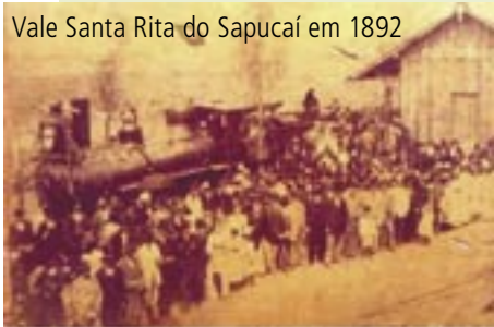
Vale Santa Rita do Sapucaí em 1892

O Sindicato das Indústrias de Aparelhos Elétricos, Eletrônicos e Similares do Vale da Eletrônica (SINDVEL/Santa Rita do Sapucaí) lançou o programa de Certificação Industrial e Avaliação