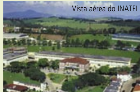
Vista aérea do INATEL

Inspirada em Albert Einstein, para quem "o futuro do mundo viria da eletrônica", foi ela quem criou, em 1959, a Escola Técnica Eletrônica Francisco Moreira da Costa (ETE), primeira da América Latina. O desenvolvimento da cidade consolidou-se com a fundação, em 1965, do Instituto Nacional de Telecomunicações (INATEL). O Instituto está em fase de acreditação junto ao Inmetro nas áreas de telecomunicações, eletrônica, física e química, e está desenvolvendo o sistema para transmissão da "TV Digital" no país.